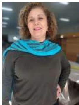
LIZIANE - JUMARA MÓVEIS